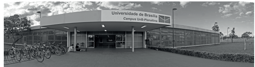
Visão panorâmica da Faculdade UnB Planaltina (FUP). Foto: Roberto Fleury, SECOM/UnB, 2008.