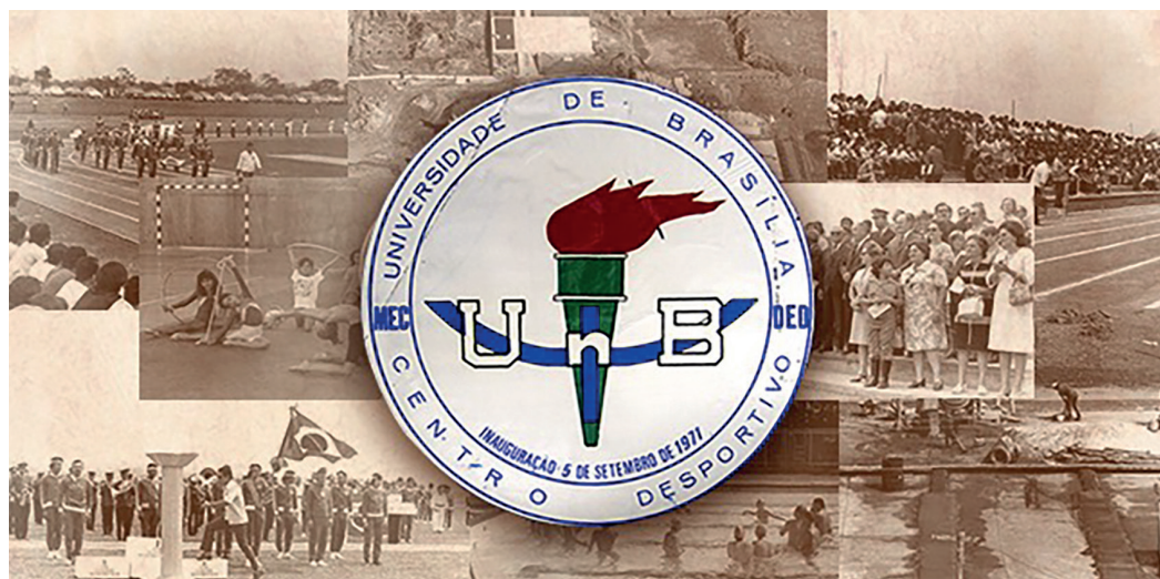
Arte: Ana Rita Grilo/Secom UnB

Emblema do Centro Olímpico: uma das provas documentais resgatadas pelo projeto “História e memória da Faculdade de Educação Física da Universidade de Brasília”