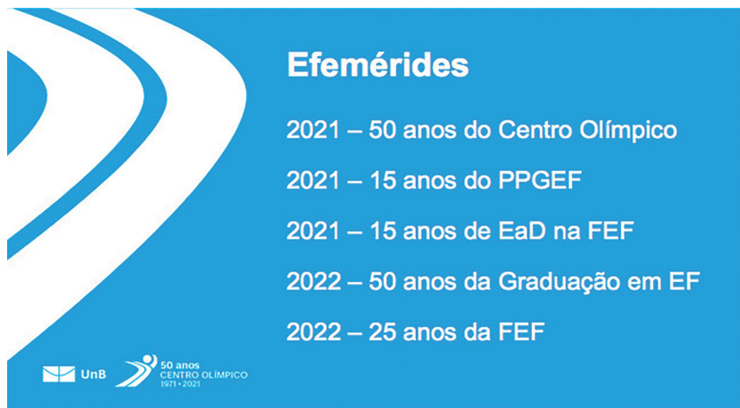
Figura 1: Efemérides