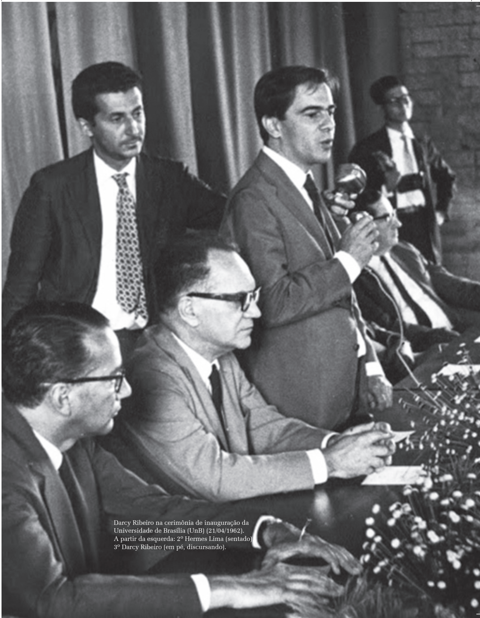
Darcy Ribeiro na cerimônia de inauguração da Universidade de Brasília (UnB) (21/04/1962). A partir da esquerda: 2º Hermes Lima (sentado) 3º Darcy Ribeiro (em pé, discursando).