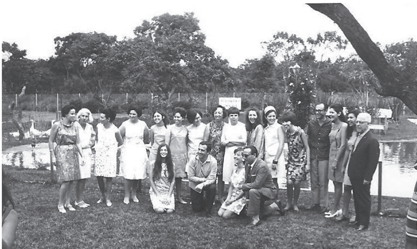
Formandos e professores no almoço de formatura da 1ª turma de Biblioteconomia da UnB (1967).