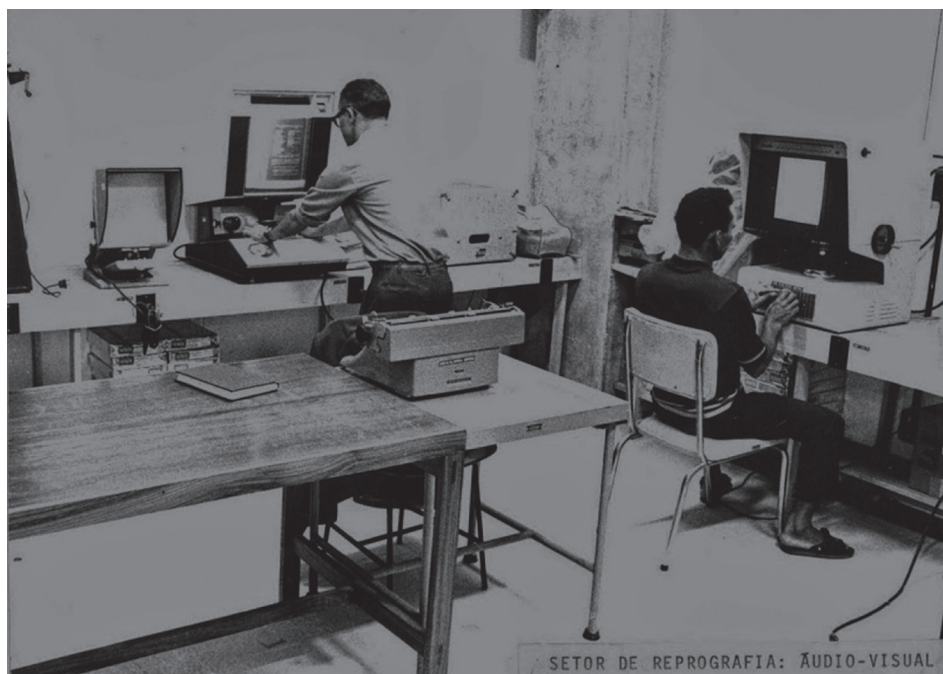
SETOR DE REPROGRAFIA: ÁUDIO-VISUAL