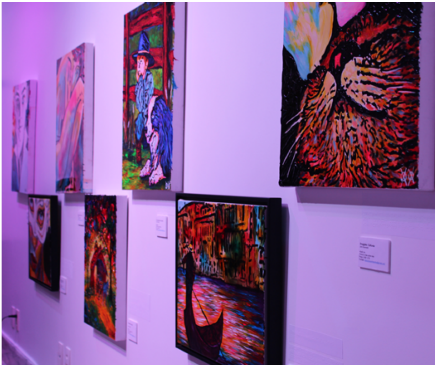
Angela Carter 1998 The Great Gatsby The Great Gatsby The Great Gatsby