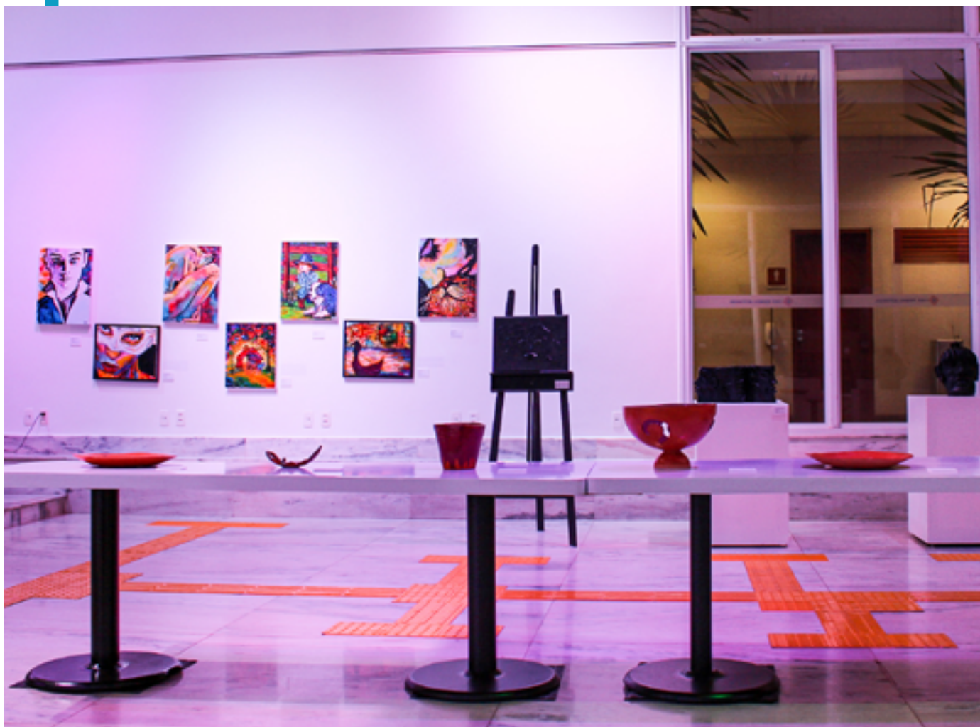
Espaço interno da galeria

A exposição foi realizada na galeria da Casa Thomas Jefferson da Asa Sul, localizada na Via W5 Sul, SEPS 706/906 da Asa Sul, no Plano Piloto da cidade de Brasília, Distrito Federal.