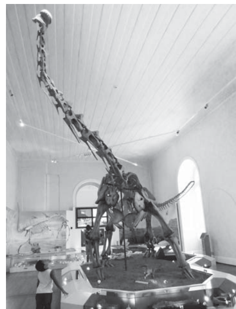
Fotografia: Monique Magaldi Museu Nacional/UFRJ, 2011

Esta publicação celebra os dez anos da aprovação do curso de Museologia no Conselho Universitário da Universidade de Brasília e assume uma vocação metalinguística ao se tornar uma memória de itinerários de pesquisa sobre a memória. Os textos aqui reunidos contribuem, de certo modo, para a história da emergência de alguns problemas centrais no campo dos museus e da Museologia, explicitando possibilidades de pesquisa. O intuito foi mapear distintos itinerários de investigação, apontando estratégias, conquistas e rupturas em um momento de profundas redefinições nos repertórios da memória.