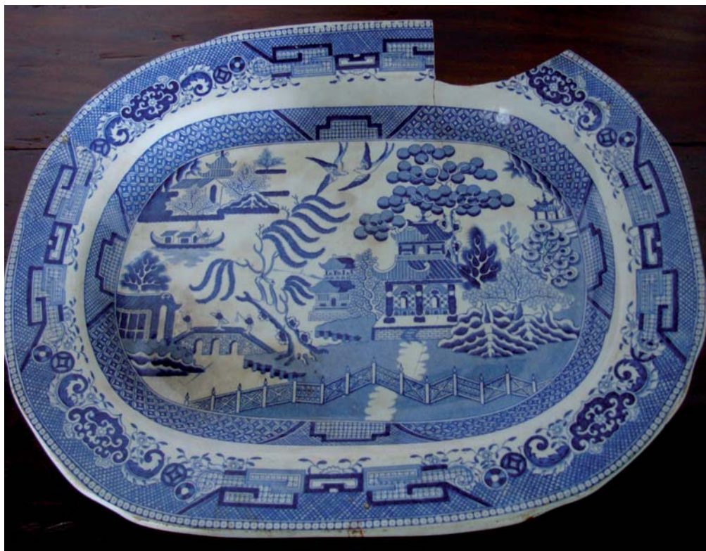
Fig. 1 – Prato Azul-Pombinho