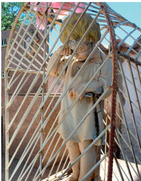
Fig. 2 – Escultura, Cemitério São Miguel, Goiás-GO.

Trata-se de uma narrativa potencializada pela oralidade. Em Goiás são comuns histórias sobre crianças castigadas em virtude de terem quebrado louças, conforme o relato de Cora Coralina. Um dos túmulos do Cemitério São Miguel, em Goiás-GO, possui a escultura de uma criança em prantos, com uma louça quebrada nas mãos (Fig. 2). As narrativas orais, literárias e museológicas se interpenetram, promovendo distintos agenciamentos que visam contribuir para, por meio de uma memória poética, evitar que tais atos tornem-se reincidentes. Essa percepção é fundamental quando visualizamos ecos do trágico nas exposições museológicas.