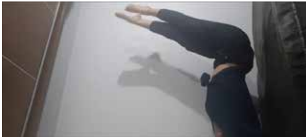
Figura 2 – Torcer