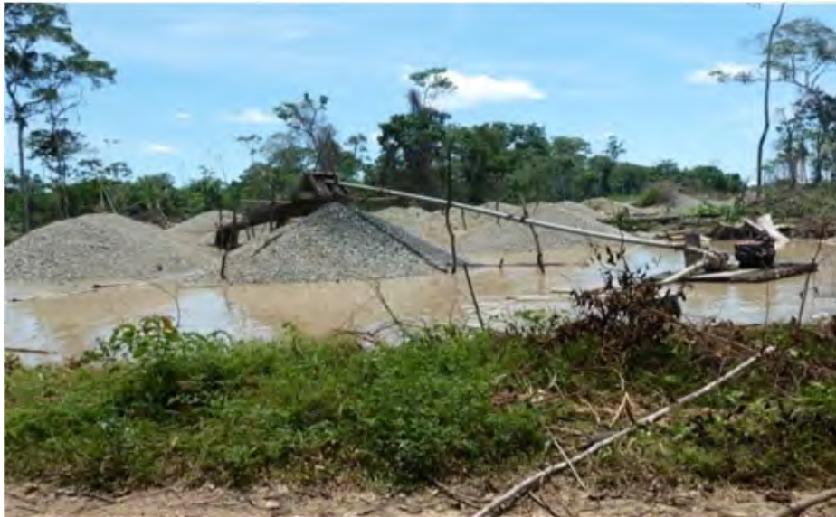
Figura 1: A Comunidade Nativa Tres Islas: contaminada pela mineração artesanal

É importante que a sentença mostre a prioridade do consumo humano de água sobre outros, da despoluição, da recuperação e do reflorestamento, entre outros aspectos. Essa sentença implica na elaboração de todo um plano de restituição efetiva de direitos e abre uma esperança a respeito da situação atual, não só da Comunidade Nativa Tres Islas, mas também de todos os povos indígenas afetados por situações parecidas. As medidas indicadas poderiam também transformar-se em uma política pública relacionada a todos os povos afetados por atividades extrativistas sem consulta prévia.