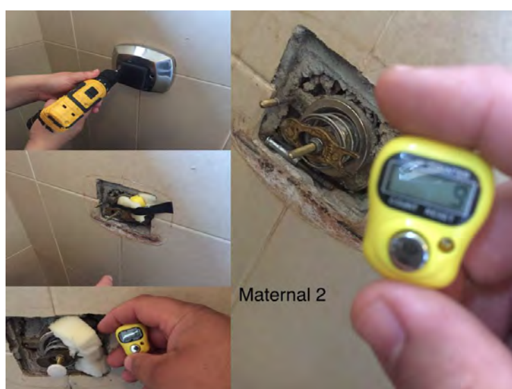
Figura 4. Instalação de contadores analógicos em válvula de descarga

Em experiências em campo, foi utilizado um contador analógico digital embutido, cujo botão de registro fica alinhado a uma paleta da tecla de acionamento da válvula de descarga, de tal modo que o usuário, ao acionar a descarga, simultaneamente faz com que a paleta acione o botão de contador, registrando que a válvula foi usada (Figura 4).