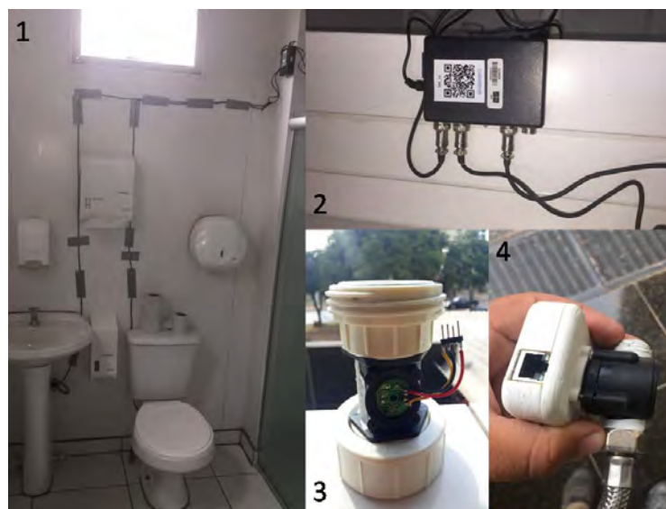
Figura 3. Equipamentos de medição específica

pressão não ultrapasse 40 m.c.a, para não danificar o medidor de fluxo (Figura 3.4).