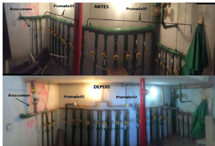
Figura 2. Setorização de medição em um barrilete de condomínio residencial

(características de rede) e secundários (componentes do medidor) e meios de calibração. Os dados devem ser consolidados em relatórios gerenciais e deve ser elaborado um calendário de manutenção preventiva e corretiva das instalações.