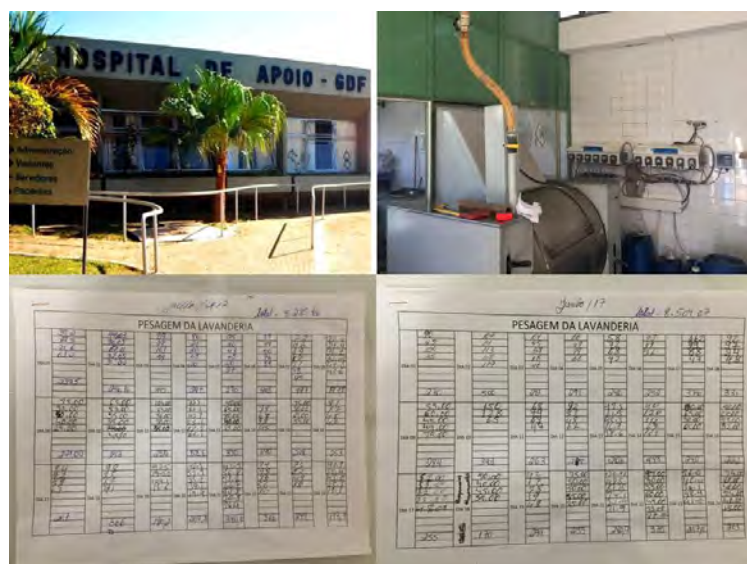
Figura 5. Exemplo de diários de Registro